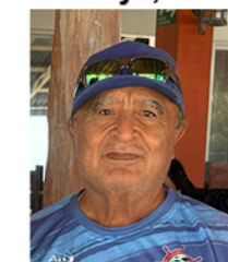
Miguel Ángel Braga y